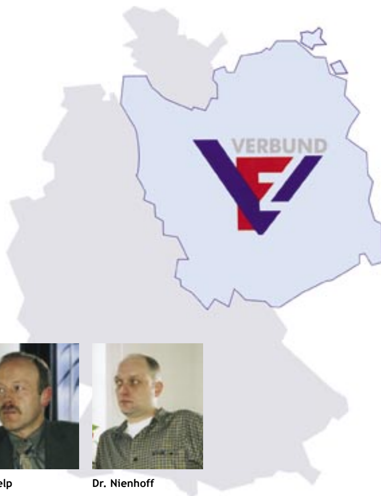
Abb. 1 Das VzF- Beratungs- gebiet

Im Januar diesen Jahres ist das Zertifizierungsaudit für den VzF-Verbund erfolgreich gelaufen. Damit ist der VzF-Verbund das erste System in der Veredlungsproduktion, das so weit und so komplett zertifiziert ist. Vom Beginn der QM-Einführung bis zur erfolgreichen Zertifizierung ist ein Zeitraum von 5 bis 6 Jahren vergangen, in dem viele Vorbereitungen, wie z. B. die Erstellung der Handbücher für jede Stufe des Verbundes, getroffen wurden.