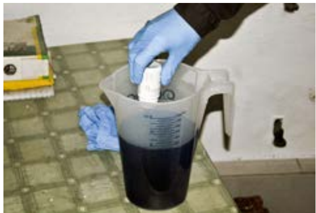
Der Wasserstabilisator dient nicht nur zum Einfärben, sondern um eventuelle Chlorreste zu neutralisieren.