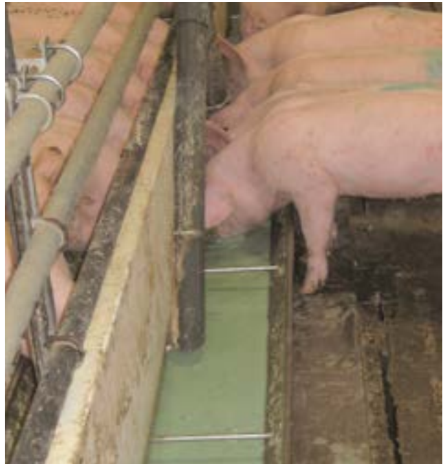
Die Ileitis-Impfung übers Flüssigfutter ist einfach und stressfrei.

Boehringer Ingelheim hat jetzt vier anschauliche Filme unter www.ileitis.de online gestellt, um dem Anwender die Ileitis-Impfung über das Flüssigfutter noch einfacher zu machen. Unterschieden wird nach Tier:Fressplatzverhältnis und restlosen- bzw. nicht-restlosen-Fütterungssystemen. So sind alle gängigen Futtersysteme abgebildet. Die Filme zeigen, wie einfach und stressfrei die Impfung über das Flüssigfutter ist.