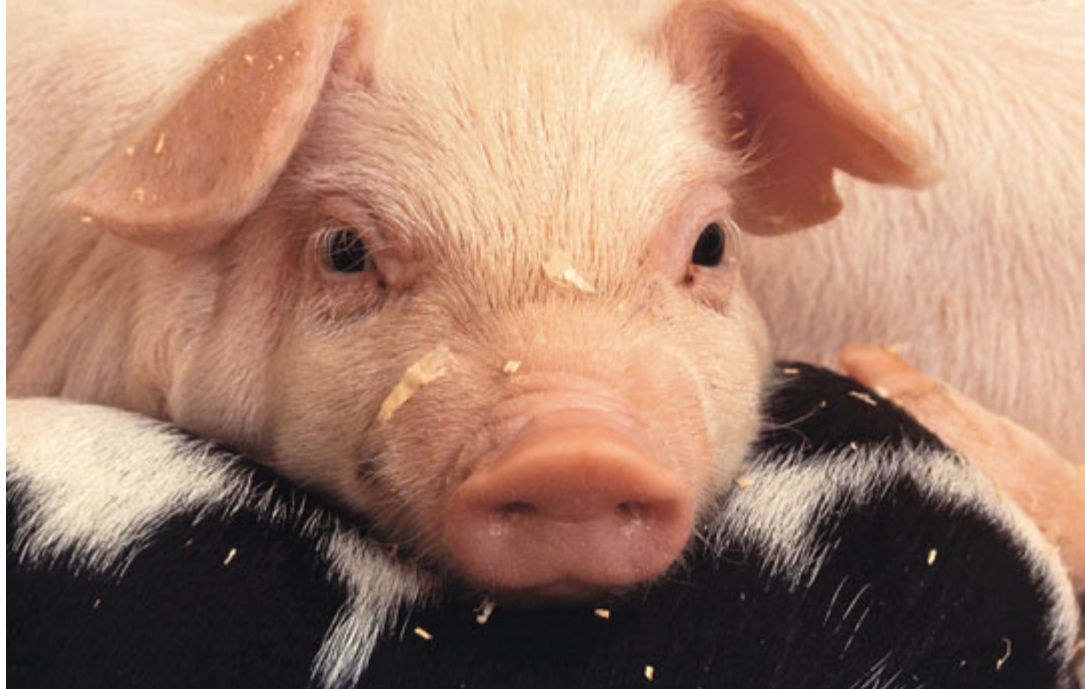
Vitales Qualitätsferkel dank Impfung.

Deutschland Impfweltmeister und geht mit positivem Beispiel voran.