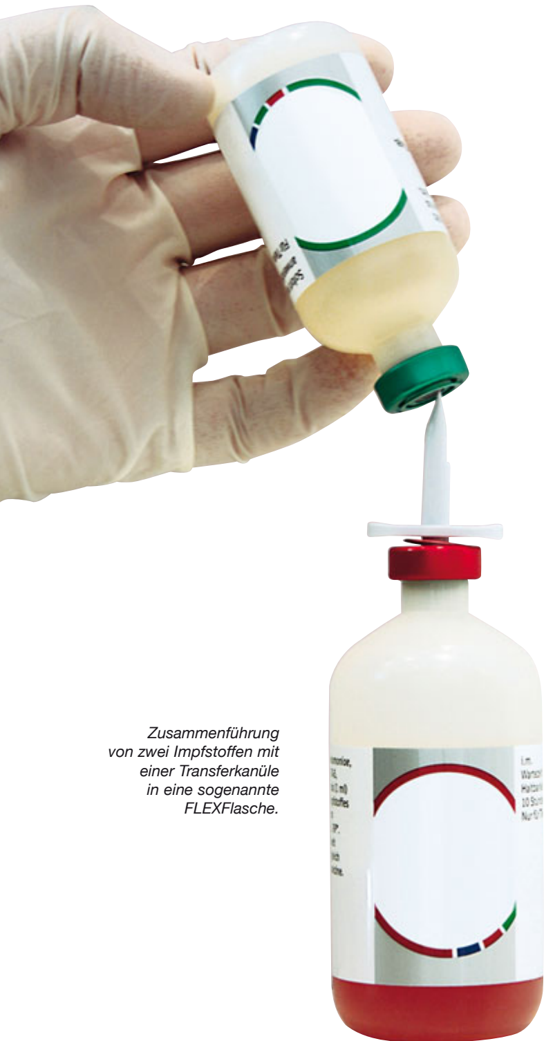
Zusammenführung von zwei Impfstoffen mit einer Transferkanüle in eine sogenannte FLEXFlasche.

Kombi-Impfstoffe sind in der Schweinehaltung immer beliebter. Eine neue Studie hat das Impfverhalten hiesiger Schweinehalter untersucht. Das Ergebnis: Deutschland ist Impfweltmeister. Allerdings gibt es regional große Unterschiede.